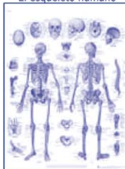
La columna vertebral